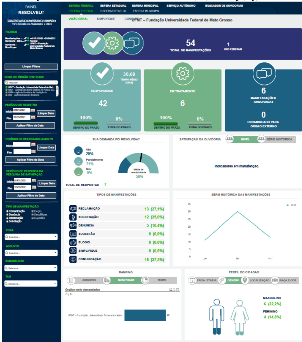
FIGURA 3 – Dados do “Painel Resolveu?” de 01/01/2021 a 31/03/2021