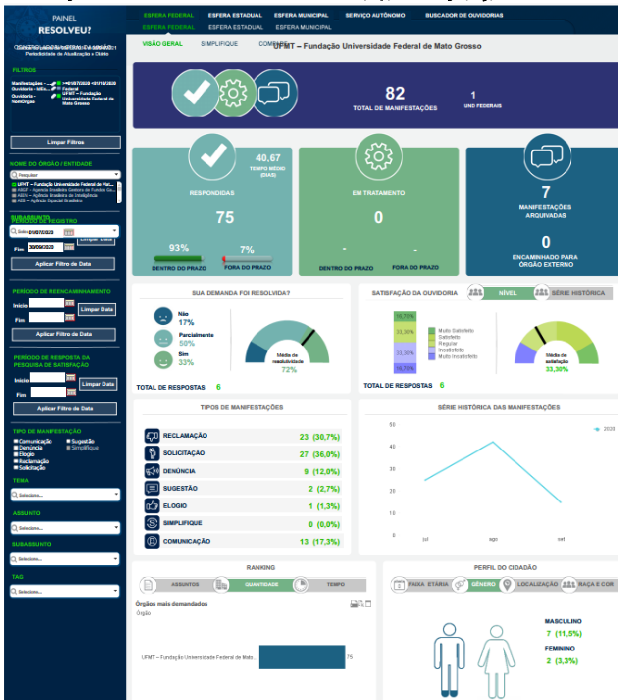
FIGURA 3 – Dados do “Painel Resolveu?” de 01/07/2020 a 30/09/2020