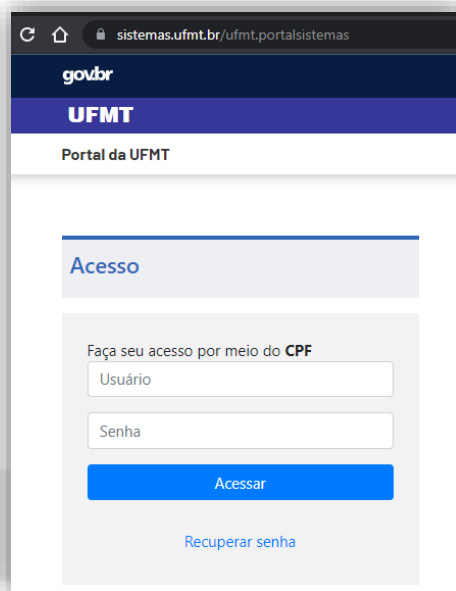
Figura 1 - Login no Portal de Sistemas Integrados.

A nova conta de e-mail estará disponível para consulta no Perfil do Portal de Sistemas Integrados. Para consultar, acesse o endereço: https://sistemas.ufmt.br . Digite seu CPF e senha cadastrada.